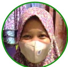
Ibu Umi Anggota KKI

“Pada seneng semuanya pada dapat beras alhamdulillah. Mudah-mudahan KKI maju. Seneng semua anggota, seneng semua! Pengennya dapet lagi. Pengennya KKI-nya maju 😊”