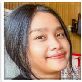
Chelsea Petugas KKI

Melalui kegiatan BERAS 2025 , KKI membagikan kepada anggota aktif paket 2,5 kg beras dan 1 liter minyak .